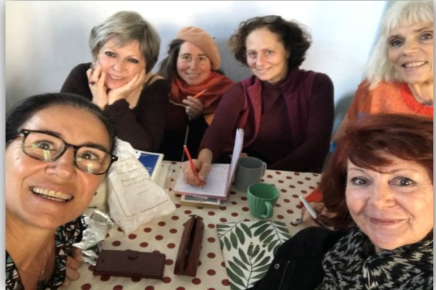
Atelier d'écriture créative