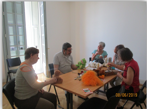
Mini stage : Objets et marionnettes dans le conte