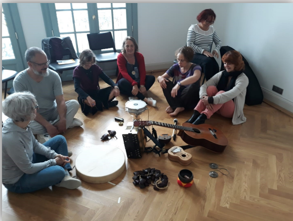
Mini stage : Parole et accompagnement sonore