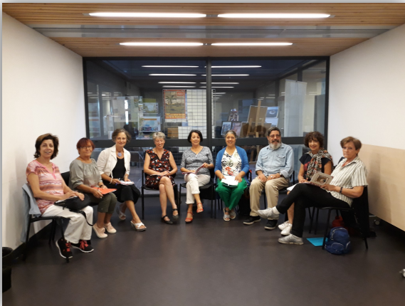
Atelier Souvenirs et récits de vie